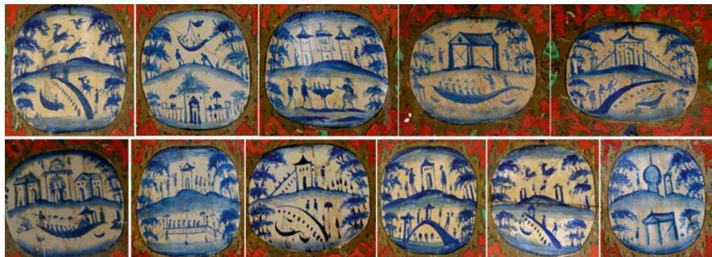
تصویر ۱۱. نقوش منظره‌سازی تورفتگی شرقی (نگارنده، ۱۳۹۶).

مجموع نقوش دیواری بنا به شیوه تمپرا ۱۹ که شیوه رایج نقاشی روی گچ در ایران بود، اجرا شده است. با توجه به مواردی همچون بیرون‌زدگی برخی قسمت‌های نقوش واقعه عاشورا از سطوح تعیین‌شده، عدم مشابهت کامل بسیاری از نقش‌مایه‌ها، از منظره‌سازی‌های فرنگی کوچک و بزرگ گرفته تا گل‌های ریز و درشت نقوش گل‌ومرغ - به‌گونه‌ای که حتی یک نمونه کاملاً مشابه در نقش‌مایه‌های به‌ظاهر مشابه نمی‌توان یافت - (تصاویر ۱۱ و ۱۲) همگی از ترسیم نقوش در محل، بدون بهره‌گیری از الگو و گرته‌برداری حکایت داشته و نشانی از درجه مهارت و استادی نقاش بوده است.