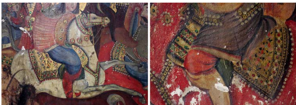
تصویر ۹. جزئیات برخی نقوش.