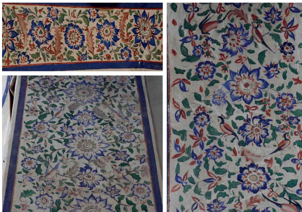
تصویر ۱۲. نقوش گل و مرغ تویزه‌های گنبدخانه.