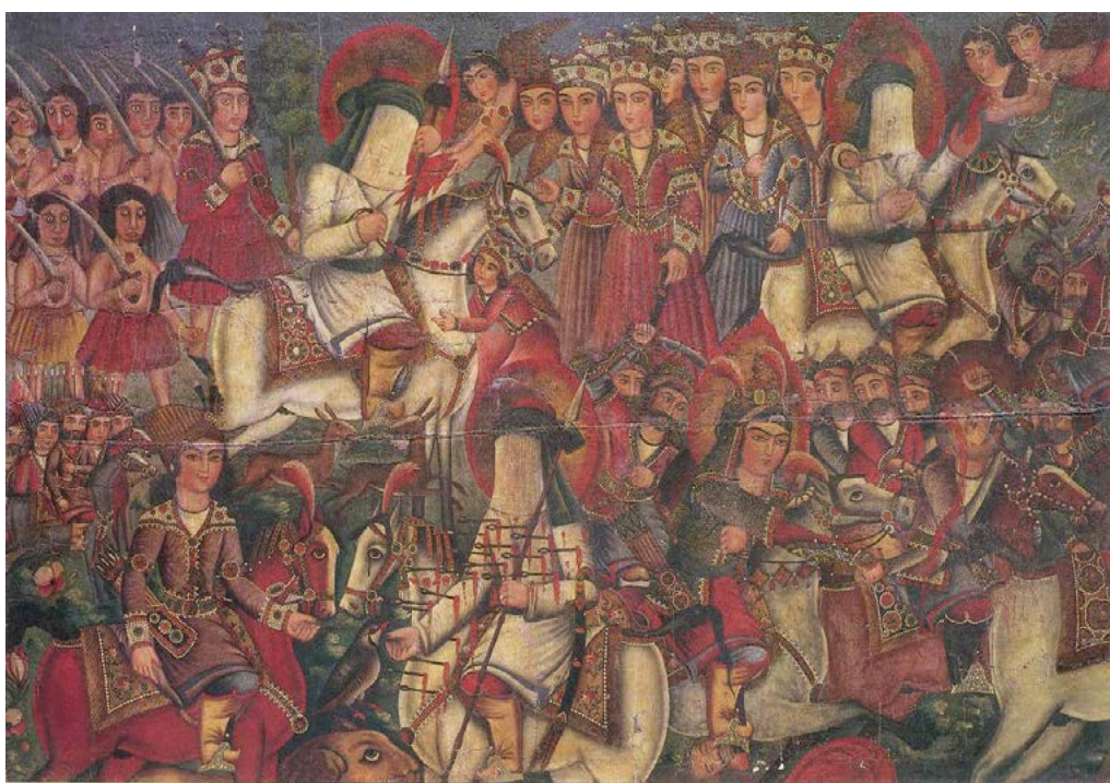
تصویر ۱۰. نقش پرده درویشی به رقم میرزامهدی نقاش شیرازی (سیف، ۱۳۶۹:۱۹۴).

معاون‌الملک کرمانشاه نیز که به نیمه اول قرن چهاردهم هجری قمری منتسب است؛ با وجود آن‌که بر رسانه هنری متفاوتی به کار رفته (سیف، ۱۳۸۹: ۱۱۱-۸۸)، نشان‌دهنده تشابهات بسیار با نمونه عبدالؤمن، به ویژه در عرصه چیره‌دستی هنرمند است.