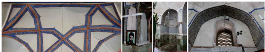
تصویر ۷. الف) نقوش گل و پرند زیر تویزه‌ها، (ب) نقوش قاب‌بندهای محرابی شکل در پیکاری اضلاع گنبدخانه، (ج) نقوش قاب‌بند محرابی طرفین صفه شرقی، (د) نقوش کاربردی ورودی جنوبی گنبدخانه (نگارنده، ۱۳۹۶).

در سالیان اخیر قسمت‌های تحتانی دیوارهای دورتادور گنبدخانه با نقوش گیاهی آبی برزمینه سفید با شیوه مهرزنی تزئین گردیده که تباین آشکاری با نقوش دیواری صفوی و قاجاری بنا دارد. کاربردی‌های گچی از دیگر تزئینات فضای داخلی گنبدخانه است که پیش‌تر بدان اشاره گردید. سطوح کاربردی‌های مذکور با نقوش زیبای گیاهی که در داخل نوارهای آبی قرار دارند، تزئین شده است (تصویر ۷: د).