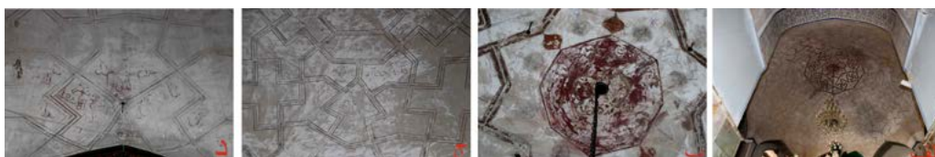
تصویر ۴. الف) نقوش گره هندسی آهیانه، ب) شمسۀ مرکزی گره چینی زیر آهیانه، ج) کتیبه‌های داخل گره، د) کتیبه صفوی پایه آهیانه (نگارنده، ۱۳۹۶).