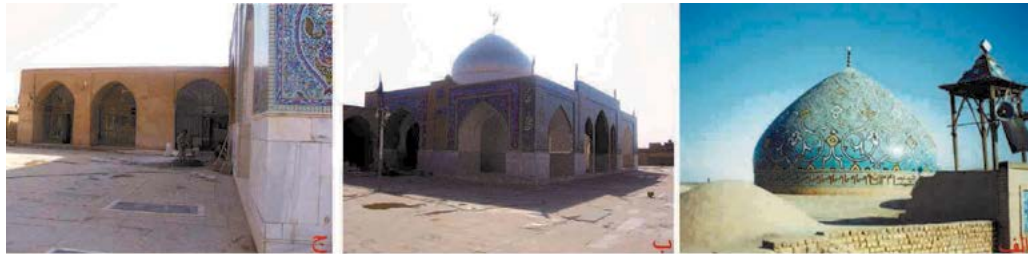
تصویر ۳: الف) پوسته بیرونی گنبدخانه قبل از تخریب، ب) خود فعلی گنبدخانه، ج) شبستان شمالی قبل از تخریب (نگارنده، ۱۳۷۸ و ۱۳۸۴).

شبدری تند آوگون دار ایجاد شد (تصویر ۳: ب). ازاره‌های فضای داخلی گنبدخانه در سالیان اخیر تا ارتفاع ۱/۵۰ متر با سنگ‌های مرمر پوشیده شده است. ضریح فعلی مقبره مستطیل شکل بوده و دارای ابعاد ۲/۳۵×۱/۸۰ متر است. این ضریح به همراه سنگ قبر اخیراً ساخته شده‌اند و اطلاعی درمورد ضریح و سنگ قبر اولیه وجود ندارد. روی پشت بام مقبره در کنار گنبد، گلدسته‌ای چوبی وجود داشت که سطح خارجی گنبد آن با کاشی‌های تک‌رنگ فیروزه‌ای و آبی تزئین شده بود. این گلدسته به دوره قاجار تعلق دارد. شبستان ستون دار و صفاها از دیگر اجزای بنا است که در اضلاع شمال غربی و غربی مجموعه قرار داشته‌اند (تصویر ۳: ج). شبستان شمال غربی، مربع شکل بوده و از چهار دهانه پوشیده شده با کلمبو و تویزه تشکیل می‌شد. بر سطح یکی از دیوارهای آن سنگ قبر مستطیل شکلی به تاریخ ۱۲۷۱ هـ.ق. وجود داشت. در قسمت غربی این شبستان سه فضای صفا مانند رو به حیاط با پوشش طاق آهنک وجود داشت که داخل یکی از آن‌ها، پلکان پشت بام به همراه سنگ قبر مرمری به تاریخ ۱۲۳۰ هـ.ق. وجود داشت (بررسی میدانی نگارنده، ۱۳۷۸).