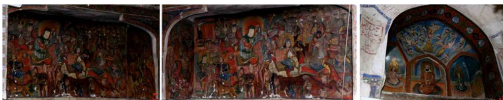
تصویر ۵. الف) نقش حضرت علی علیه السلام و حسنین علیه السلام ، ب) نقش واقعه عاشورا از جنوب غربی، ج) نقش واقعه عاشورا از شمال غربی (نگارنده، ۱۳۹۶).

از دیگر تزئینات نقوش دیواری بنا، تزئیناتی است که بر سطح داخلی تویزه‌های فضاهای تورفته گنبدخانه ایجاد گردیده است. این تزئینات شامل شاخ و برگ، گل و پرندگان است که رنگ‌های آبی، سفید، قرمز و سبز بر زمینه سفید در آن‌ها به کار رفته است (تصویر ۷: الف). دورتادور این نقوش حاشیه‌هایی از خطوط آبی و قرمز وجود دارد. به غیر از موارد یادشده، دسته دیگر از نقوش دیواری این بنا، قاب‌بندهایی است که در دو ردیف بالا و پایین بر سطوح پخ اتصال اضلاع هشت‌گانه گنبدخانه قرار گرفته است (تصویر ۷: ب). این نقوش در قسمت فوقانی به شکل کادر ساده آبی رنگ