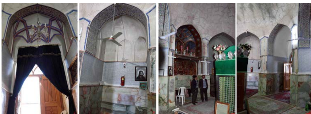
تصویر ۲. الف) صفت‌های فضای داخلی گنبدخانه، ب) صفت شرقی گنبدخانه، ج) نحوه پوشش صفت‌ها، د) کاربردی ورودی جنوبی (نگارنده، ۱۳۹۶).

بخش داخلی گنبدخانه فضایی است هشت ضلعی به ابعاد 7 \times 7 متر که در هر ضلع آن یک تورفتگی صافمانند وجود دارد (تصویر ۲: الف). هرکدام از صفت‌ها دارای دهانه‌ای به عرض ۲ متر و عمق‌های مختلفی در حدود ۲، ۳ و 2/30 متر دارد. گوشه‌های صفت به غیر از گوشه شمال غربی که مستطیل شکل است، همگی به شکل دوزنقه بوده و صفت‌های وسط اضلاع هشت‌گانه، همگی مستطیل شکل است. دو عدد از آن‌ها به ورودی غربی و جنوبی راه داشته و سطح داخلی صفت شرقی دارای تزئینات زیبای نقاشی دیواری است (تصویر ۲: ب). طاق‌زنی این صفت‌ها به یک اسلوب واحد صورت گرفته است؛ به این صورت که در جلو با تویزه و در عقب با کنه‌پوش پوشیده شده‌اند (تصویر ۲: ج). کنه‌پوش صفت مرکزی جبهه جنوبی گنبدخانه که ورودی جنوبی در آن قرار دارد؛ برخلاف سایرین که ساده رها شده، با تزئینات کاربردی گچی پوشش یافته است (تصویر ۲: د). برفراز این هشت ضلعی تشکیل شده از مجموعه صفت‌ها، گنبد بنا قرار گرفته است.