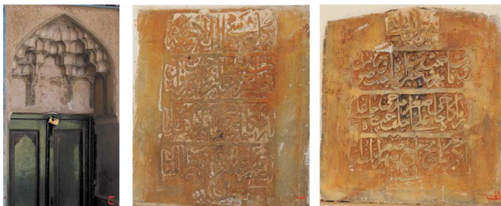
تصویر ۱. الف) سنگ قبر، ب) سنگ قبر، ج) نمای بیرونی ورودی غربی گنبدخانه (نگارنده، ۱۳۹۶).

بخش داخلی گنبدخانه فضایی است هشت ضلعی به ابعاد 7 \times 7 متر که در هر ضلع آن یک تورفتگی صافمانند وجود دارد (تصویر ۲: الف). هرکدام از صفت‌ها دارای دهانه‌ای به عرض ۲ متر و عمق‌های مختلفی در حدود ۲، ۳ و 2/30 متر دارد. گوشه‌های صفت به غیر از گوشه شمال غربی که مستطیل شکل است، همگی به شکل دوزنقه بوده و صفت‌های وسط اضلاع هشت‌گانه، همگی مستطیل شکل است. دو عدد از آن‌ها به ورودی غربی و جنوبی راه داشته و سطح داخلی صفت شرقی دارای تزئینات زیبای نقاشی دیواری است (تصویر ۲: ب). طاق‌زنی این صفت‌ها به یک اسلوب واحد صورت گرفته است؛ به این صورت که در جلو با تویزه و در عقب با کنه‌پوش پوشیده شده‌اند (تصویر ۲: ج). کنه‌پوش صفت مرکزی جبهه جنوبی گنبدخانه که ورودی جنوبی در آن قرار دارد؛ برخلاف سایرین که ساده رها شده، با تزئینات کاربردی گچی پوشش یافته است (تصویر ۲: د). برفراز این هشت ضلعی تشکیل شده از مجموعه صفت‌ها، گنبد بنا قرار گرفته است.