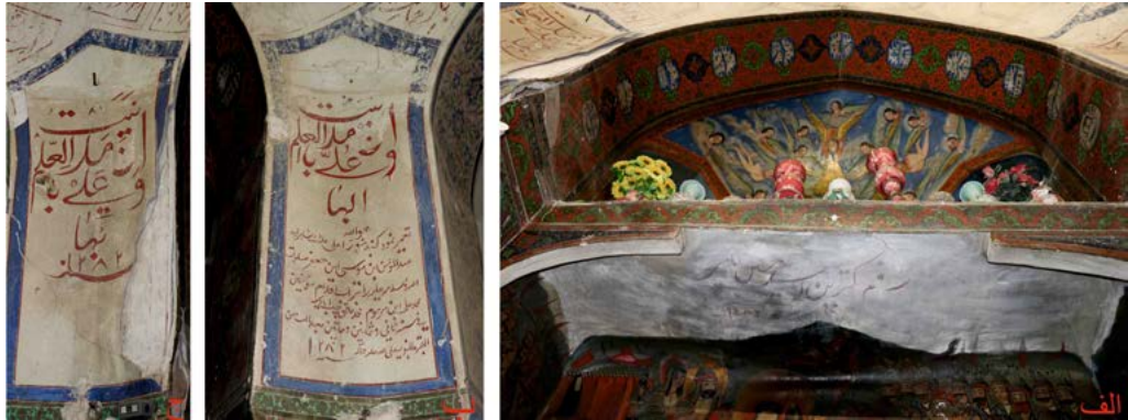
تصویر ۶. الف) تاریخ و رقم نقوش صفه شرقی (ب) کتیبه سمت راست صفه شرقی (ج) کتیبه سمت چپ صفه شرقی (نگارنده، ۱۳۹۶).

بوده و در پایین به صورت قاب‌بند محرابی شکلی است که از سه ردیف نوار حاشیه‌ای با نقوش مرواریدگون، گیاهی و بعضاً کادرهای بیضی شکل منظره‌ها تشکیل شده و لچکی‌های آن با نقوش گیاهی به‌ویژه گل ترمه تزئین شده است. دو نمونه از این قاب‌بندهای محراب شکل بر دو حاشیه کناری طرفین کمرپوش نیز وجود دارد (تصویر ۷: ج). رنگ‌های مورد استفاده در این نقوش سبز، قرمز، آبی و ماشی با ته‌زمینه طلایی رنگ است.