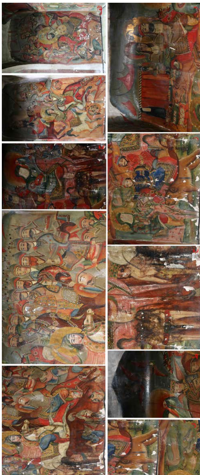
تصویر ۸. الف) نبرد حضرت عباس علیه السلام با ماردف بن سدیف، ب) حضرت قاسم علیه السلام با پسران ارزق شامی، ج) حضور امام حسین علیه السلام به همراه حضرت علی اصغر علیه السلام در نزد سپاه شامیان، د) عمرین سعد و لشکر شامیان، ه) نبرد حضرت علی اکبر علیه السلام با شارق بن شیث، و) خرگاه امام حسین علیه السلام ، ز) دیدار سلطان قیس با حضرت امام حسین علیه السلام ، ح) حضور زعفر جنی و یاران، ط) حضور ملک منصور و دیگر ملثک، ی) وجود حیواناتی همچون شیر، آهو و کبک (نگارنده، ۱۳۹۶).